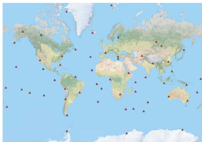
Figure 4. Réseau DORIS

Schiavon M. (2006) Les officiers géodésiens du service géographique de l'armée et la mesure de l'arc de méridien de Quito (1901-1906) . Histoire et mesure XXI-2, 2006.