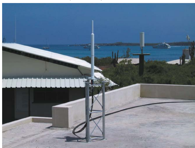
Figure 5. Station DORIS aux Galapagos