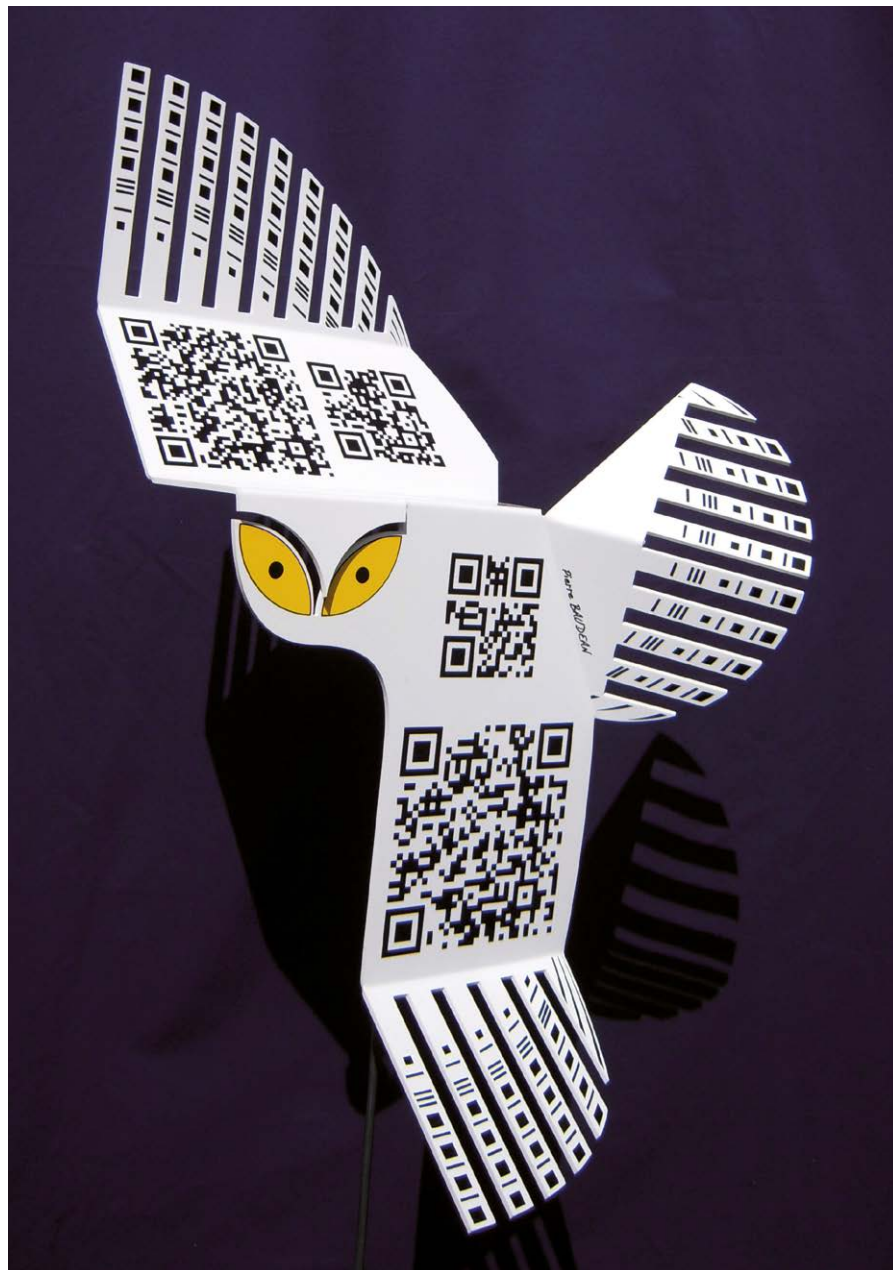
"Le harfang des neiges"

Synthèse des deux occupations, la vitrine principale contient une 4CV Renault couleur vert d'eau qui, entre tableaux et pièces en tout genre, prend aussi une dimension d'œuvre d'art. La première exposition date de septembre 2011.