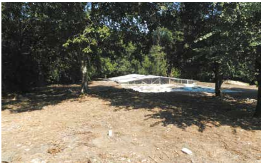
Secteur de fouille n°6, Dikili Tash

La base de données, riche de 50 ans de fouilles archéologiques, est composée, dans sa forme primaire, d'une vingtaine de tables contenant les données attributaires des vestiges archéologiques (parures, céramiques, objets en pierre taillée, figurines anthropomorphiques, restes végétaux...), les données connexes aux vestiges (unités stratigraphiques, locus, recoupements avec d'autres objets comme pour les vestiges fragmentés...) et pour finir les données descriptives (table des données topographiques, table des photographies...). Cette base de données est beaucoup