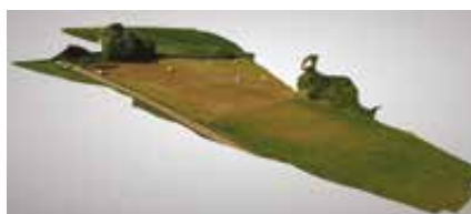
Figure 2. Modèle Numérique d'Élévation obtenu avec Recap 360

Ces deux modes de vol permettent de survoler la majorité des objets qui pourraient être amenés à être modéliser. Il existe encore des exceptions que le cabinet ne pourrait pas réaliser comme des projets longilignes. Mais cela dépend plus du drone utilisé que de la méthodologie mise en place durant les vols.