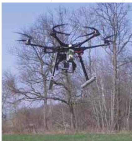
Figure 1. Drone DJI S800 en vol

L’investissement financier peut donc rapidement devenir très important, mais il faudra aussi passer beaucoup de temps à préparer les vols ou à obtenir les autorisations de vol de la part de la Direction Générale de l’Aviation Civile (DGAC). Aujourd’hui, de nombreux pilotes de drone volent dans l’illégalité du fait de cette législation très restrictive. Cependant, cette législation a été écrite en pensant en priorité à la sécurité de chacun plutôt qu’à la simplicité de se lancer dans un nouveau marché. Il serait donc dommage de ne pas être assuré en cas de problèmes lors d’un vol après les investissements réalisés. Après avoir obtenu les certifications quant à la conformité du drone, le futur pilote de drone doit passer un examen théorique d’ULM. Cette épreuve est la plus simple