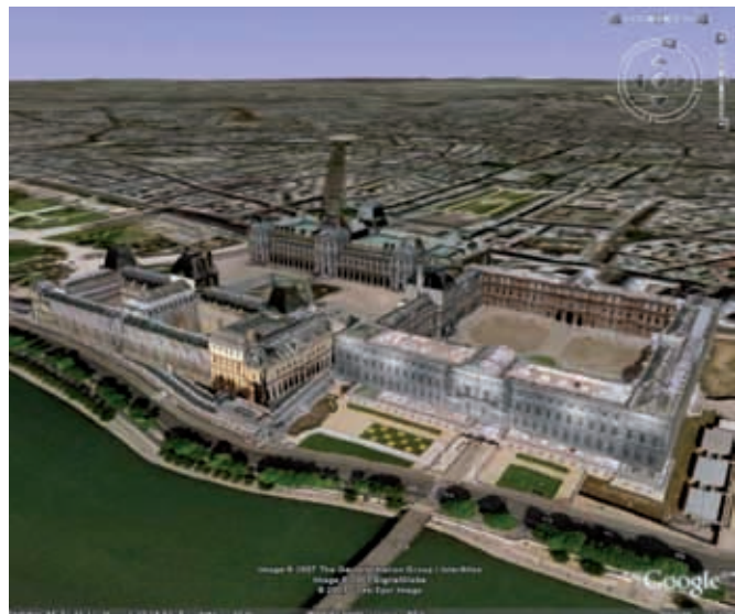
Figure 1. Musée du Louvre en 3D

Le relief et la troisième dimension ont fait leur apparition dans les SIG depuis plusieurs années : modèles ajoutant l'information d'altitude, dits "2D et demi", comme les Modèles Numériques de Terrain (MNT), de Surface (MNS) ou d'Élévation (MNE) ; modèles 3D avec surfaces et volumes. Le développement très rapide et grand public du rendu virtuel de villes en 3D, avec par exemple Virtual Earth (Microsoft) [Web VirtualEarth], le Géoportail (IGN) [Web Géoportail] ou Google Earth (Figure 1) [Web GoogleEarth], en a démontré l'intérêt. On peut également citer d'autres applications des SIG, trouvant un avantage à l'information 3D : aménagement urbain, architecture et planification urbaine, voirie, génie civil ; choix de tracés routiers ou ferroviaires, transport ; protection civile ; protection environnementale, gestion de ressources naturelles (les forêts par exemple), géologie ; guidage et localisation par systèmes de navigation personnels (automobilistes) ou directement sur téléphone mobile (piétons) ; applications militaires ; simulation, jeux virtuels ; tourisme virtuel.