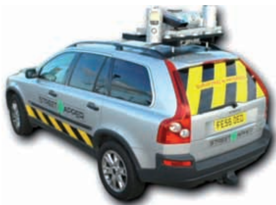
Figure 3. StreetMapper (3DLM) – exemple de système commercial

Le POS est un élément critique pour un Système Mobile de Cartographie. En effet, la production de points 3D précis exige un géo-référencement également précis du véhicule. Idéalement, pour que les systèmes mobiles puissent concurrencer la précision fournie par les systèmes fixes, les ordres de grandeur attendus en termes de précision du POS sont de l'ordre du centimètre en position et du degré en orientation. Or les informations INS sont soumises à dérive au cours du