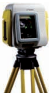
Scanner fixe - VX Trimble

Un deuxième critère de comparaison est la qualité du relevé laser. Plusieurs éléments sont à prendre en considération que l'on peut catégoriser ainsi : précision, résolution et homo-