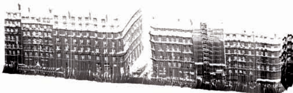
Figure 4. Rue Soufflot, Paris 5 e – relevés par scanner fixe et mobile