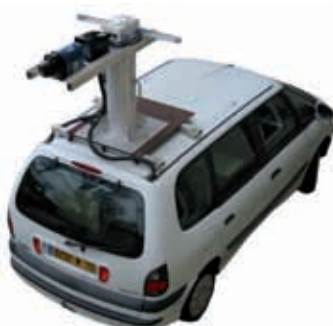
Scanner mobile - LARA-3D