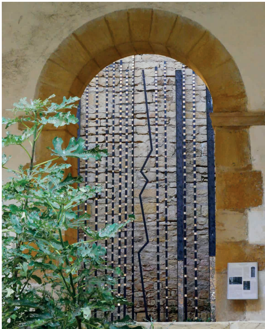
Fenêtre sur cour, vue depuis le cloître.

tion de mosaïstes internationaux, a conduit à la constitution dès l'an 2000 d'une association dédiée et dévouée à la mosaïque, devenue en 2008 "M comme Mosaïque". M comme mosaïque gère la Maison de la mosaïque contemporaine qui s'ajoute à l'offre touristique et culturelle locale en organisant des expositions, des formations et par l'édition.