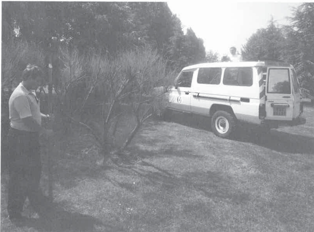
Implantation/levé en visées rayonnées à partir de la station inertielle