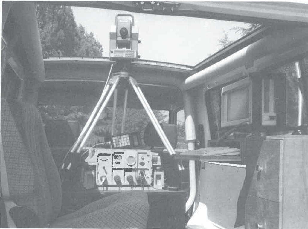
Système GEODINE 30 - Tachéomètre électronique en position haute

La méthode est également applicable aux études gravimétriques.