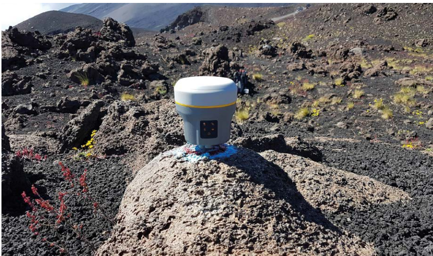
Récepteur GNSS Trimble R10