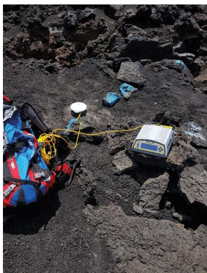
Récepteur Trimble Alloy

Pour répondre à la question du géodésien, les coordonnées sont exprimées en ITRF2014 pour comparaison, tandis que les altitudes sont obtenues grâce à des hauteurs ellipsoïdales en ITRF2014 corrigées de l'ancien modèle EGM96 pour homogénéité avec les anciennes données.