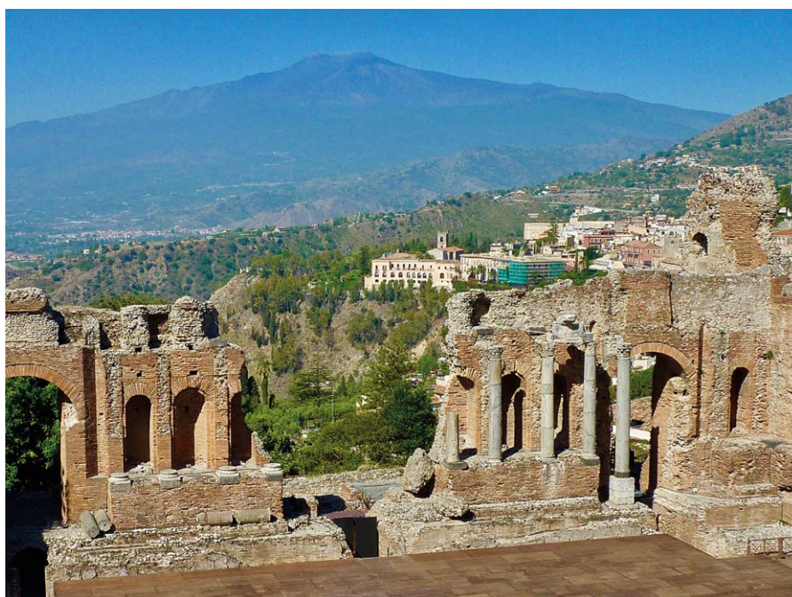
L'Etna depuis le théâtre de Taormine